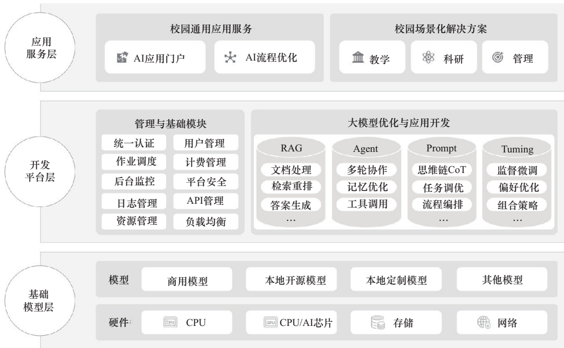
图2 校园 AI Hub 架构